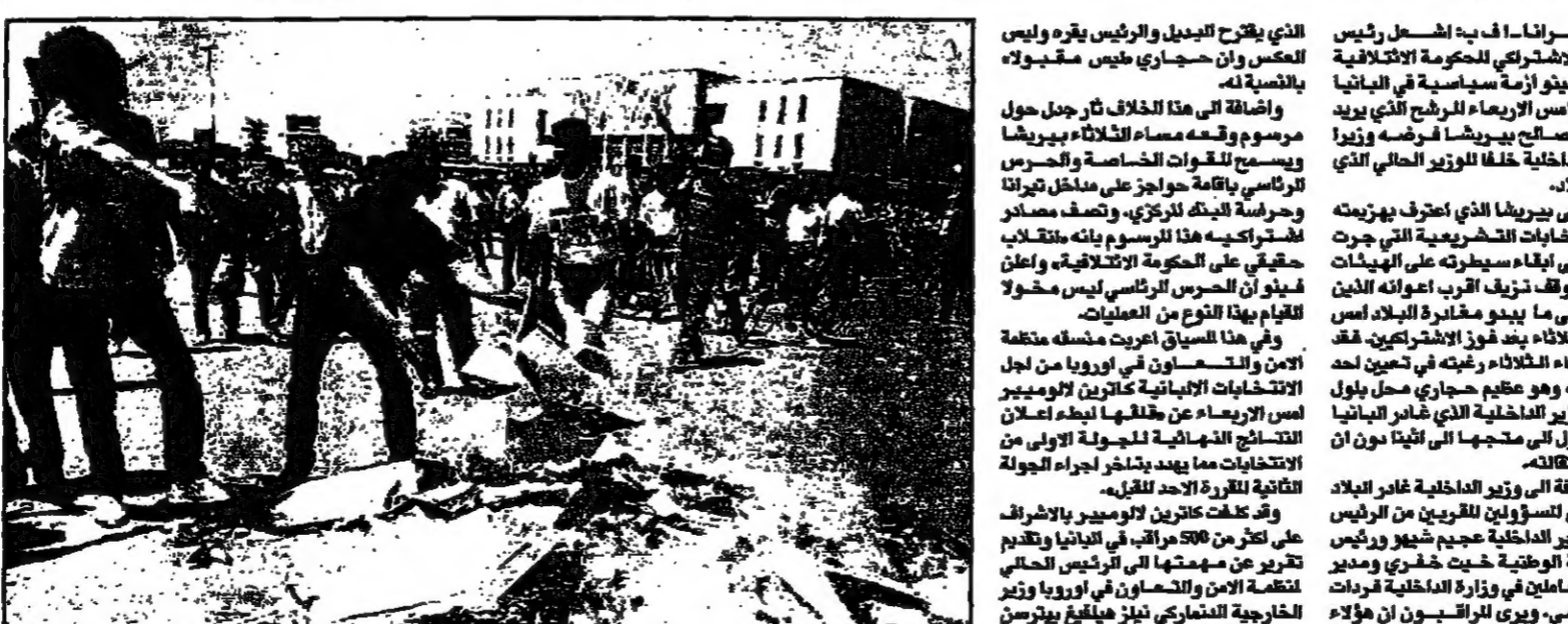
مؤتمرون ايبانكا ايبانكا الاول يحرقون حلقهات انتخابية للحزب الاشتراكي الالباني خلال مظاهرة تحت اسم في خيرانا